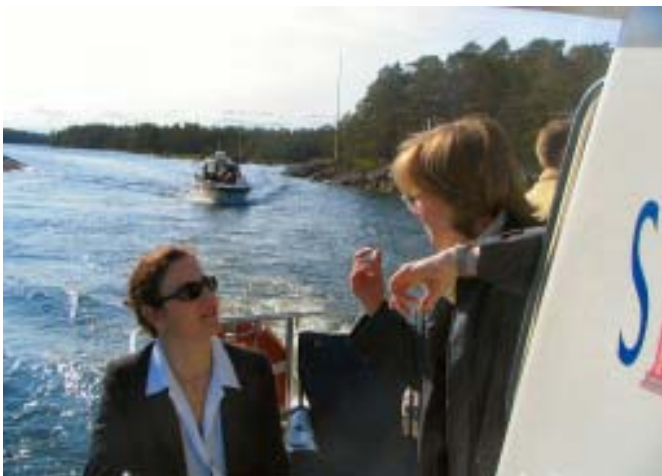
Aurinkoinen tutustumisretki Itä-Uudenmaan saaristoon.

Puheessaan hän nosti esiin ohjelmien strategisuuden sekä aluepolitiikan keskeisen aseman vahvistamisen tulevalla kaudella. Strategisuus on erityisen tärkeää tavoite 2 -alueilla, sil-