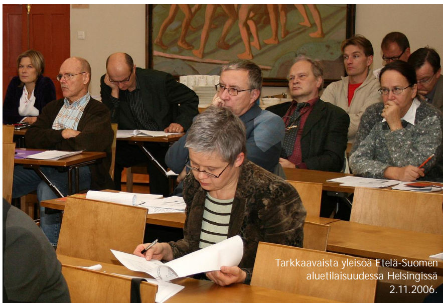
Tarkkaavaista yleisöä Etelä-Suomen aluetilaisuudessa Helsingissä 2.11.2006.

Aluetilaisuuksissa maaseutumaisien seutujen ohjelmallisen kehittämisen vahvistamista pidettiin tärkeänä, vaikka ohjelmien lisääntymiseen suhtauduttiinkin alkuun varauksella. Sisäasiainministeriön käden ojennusta maaseudun kehittämisen vahvistamiseksi pidettiin tärkeänä askeleena – huolimatta siitä, että vuodelle 2007 varattu miljoona euroa tuntuukin