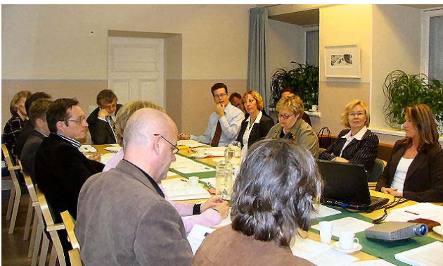
Interreg IIIA Saaristo-ohjelman edustajat koolla Helsingissä.

Valtioiden välisen yhteistyön ohjelma-alueista sovittiin käytännössä loka-kuussa komission ja jäsenmaiden välisessä kokouksessa. Komissio toimitti karttakuvat ja listaukset sovitusta ohjelma-alueista joulukuun puolivälissä. Itämeren ohjelma-alue säilyy nykyise-