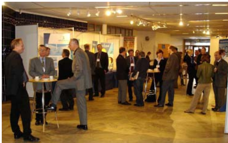
Kuva: Lapin liitto.

Lappilaisia EAKR-hankkeita esiteltiin neljällä eri ekskursiolla, jotka suuntautuivat Kolariin ja Kurtakkoon, Sodankylään ja Luostolle, Kemiin, Tornioon ja Haaparannalle sekä Rovaniemen seu-