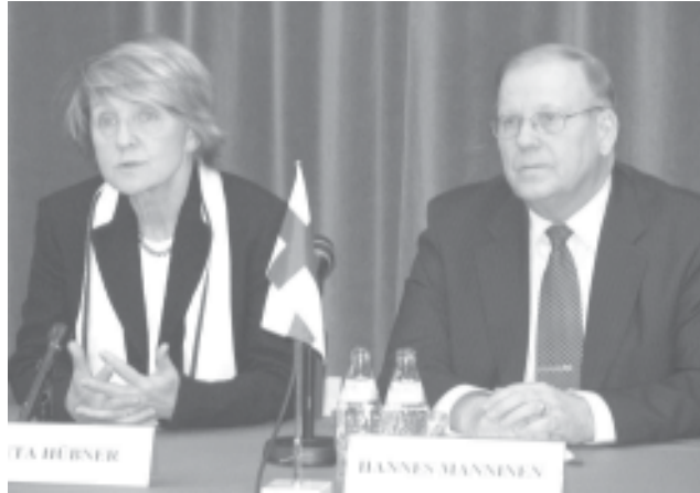
Komissaari Danuta Hübner (vas.) ja alue- ja kuntaministeri Hannes Manninen.

EU:n aluepolitiikasta vastaava komissaari Danuta Hübner vieraili Suomessa alue- ja kuntaministeri Hannes Mannisen kutsusta 25.–26. marraskuuta 2004. Hän aloitti uudessa tehtävässään samalla viikolla. Vierailun aikana Hübner tapasi Mannisen lisäksi pääministeri Matti Vanhasen ja ulkoministeri Erkki Tuomiojan sekä eduskunnassa suuren valiokunnan edustajia. Keskusteluissa oli esillä ohjelmakauden 2007–2013 rahoituskehitykset, Itä- ja Pohjois-Suomen erityistarpeet sekä Suomen ja Venäjän väliset naapuruusohjelmat.