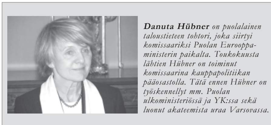
Danuta Hübner on puolalainen taloustieteen tohtori, joka siirtyi komissaariksi Puolan Eurooppaministerin paikalta. Toukokuusta lähtien Hübner on toiminut komissaarina kauppapolitiikan pääosastolla. Tätä ennen Hübner on työskennellyt mm. Puolan ulkoministeriössä ja YK:ssa sekä luonut akateemista uraa Varsovassa.