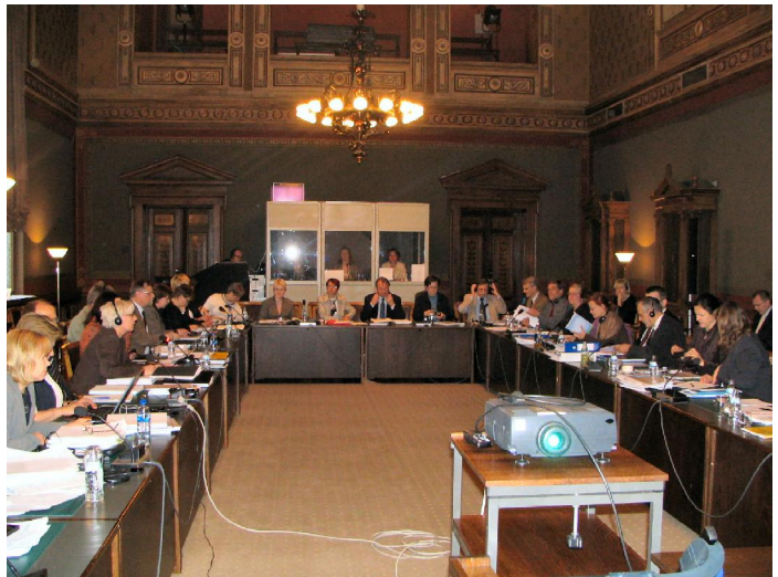
Neuvottelut pidettiin Helsingin Säätytalolla.

Huolimatta siitä, että toimenpideohjelmien hyväksymismenettelyt ovat vielä kesken, tarkastellaan mahdoli-