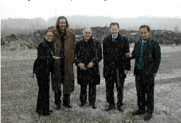
Maatutkintaryhmä raesateessa Talvivaaran kaivoksella.