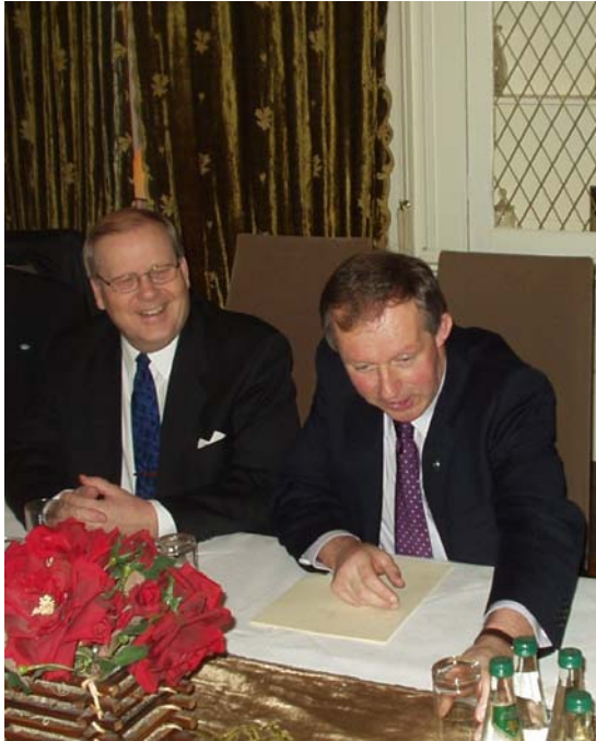
Ministeri Manninen ja kokouksen irlantilainen puheenjohtaja, ministeri Tom Parlon.