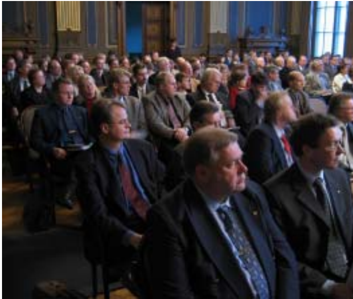
Säätytalolla 9.12. järjestetty arviointiforum keräsi koolle odotettua enemmän kuulijoita sekä keskushallinnosta että alueilta.